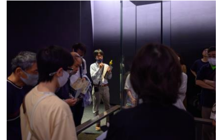
過去のギャラリートークの様子