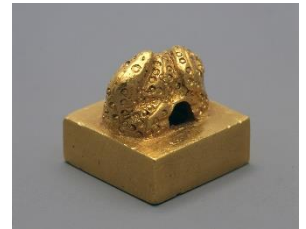
国宝 金印「漢委奴国王」