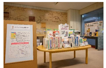
過去の本の紹介の様子